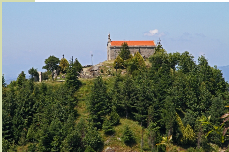
Capela do monte Alba.