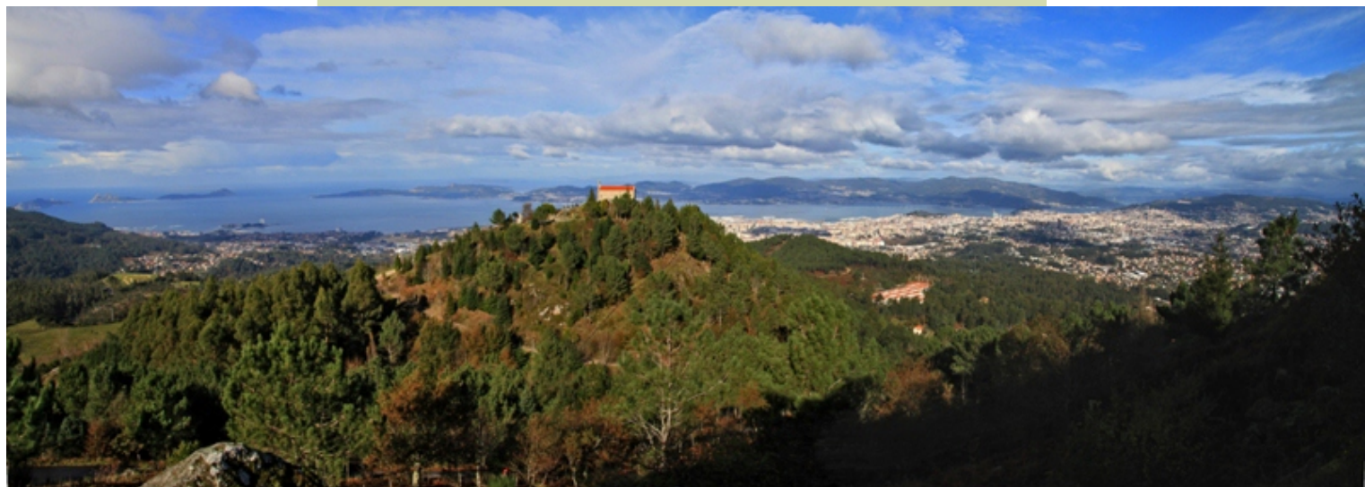
Vigo desde o cumo do Cepudo. No primeiro plano, coroado pola capela, o monte Alba.