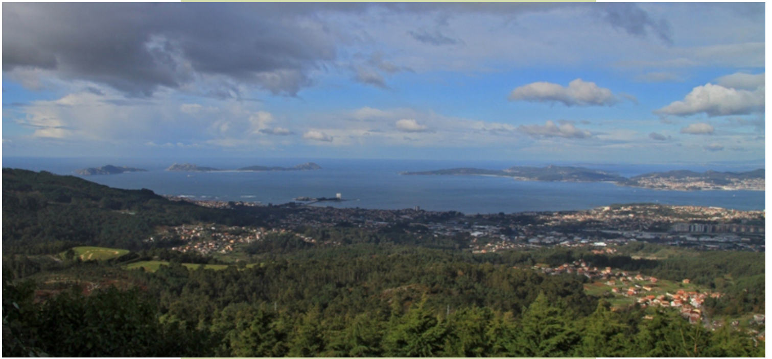
Vista parcial de Vigo e a ría desde o cumo do Monte Alba.