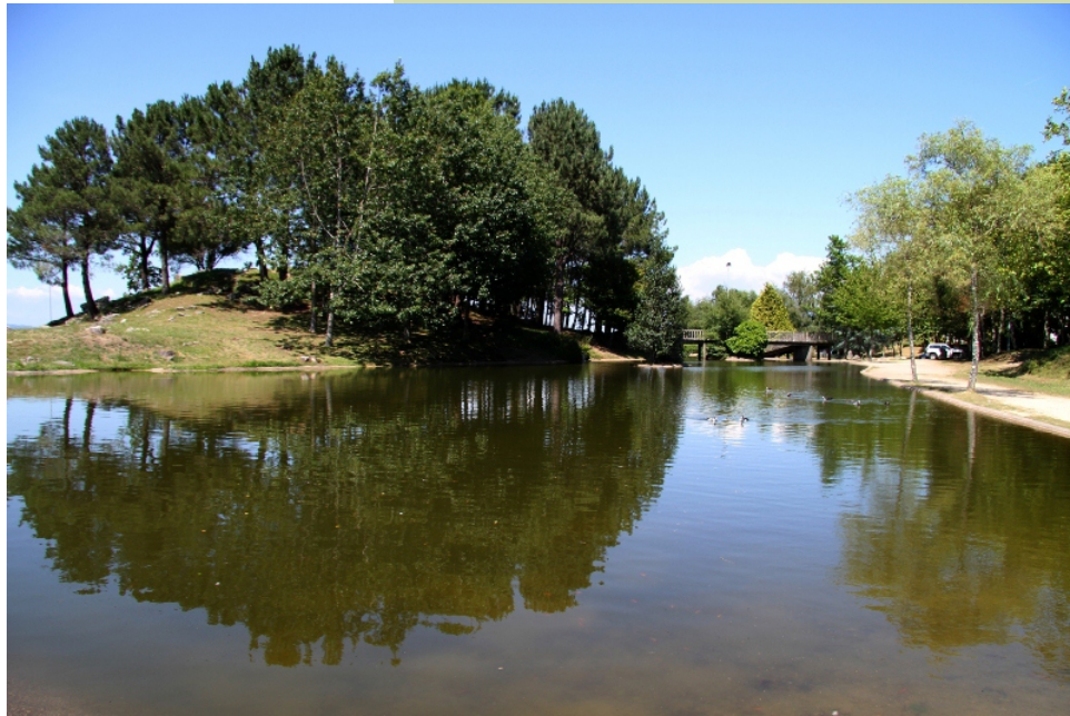
Lagoa artificial no Monte dos Pozos.