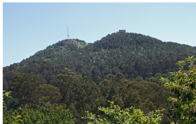
Cumes dos montes Alba e Cepudo.